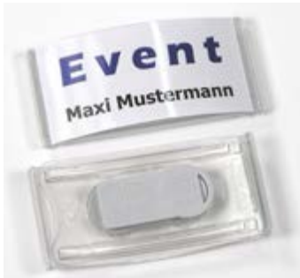
Event 40, mit Papiereinlage und Magnet Smag-Pro

Das Namensschild ist besonders preiswert aber auffallend attraktiv.