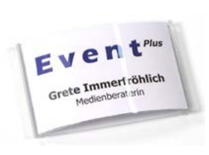
Event 60, mit Papiereinlage