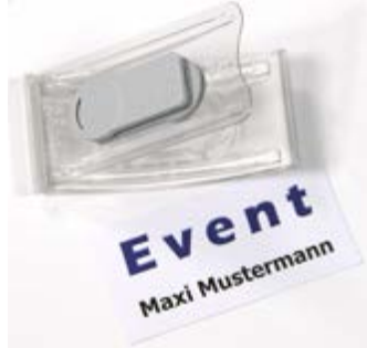
Event 40, geöffnet zum Austausch der Namenskarte