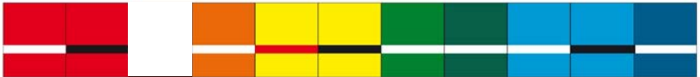
P248 rot-weiss, P249 rot-schwarz, P240 braun-weiss, P277 orange-weiss, P234 gelb-rot, P235 gelb-schwarz, P205 apfelgrün-weiss, P259 waldgrün-weiss, P233 hellblau-weiss, P227 hellblau-weiss, P226 blau-weiss