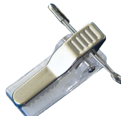
Größe 30 mm lang Gewicht 2,5 Gramm