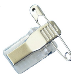
Größe 26 mm lang Gewicht 2 Gramm