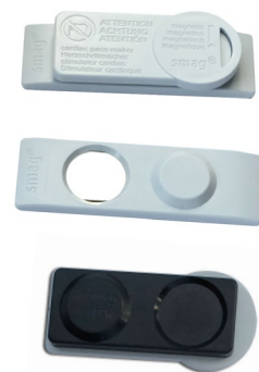
Größe 50/45 x 16/19 x 9 mm Gewicht 17 Gramm