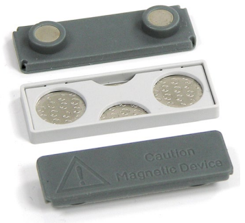
Größe 46 x 15 x 9 mm Gewicht 15 Gramm

Wissenswertes: ca. 75 % aller Namensschilder werden mit Magnet ausgeliefert.