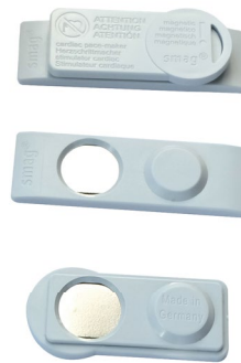
Größe 50/45 x 16/19 x 7 mm Gewicht 15 Gramm