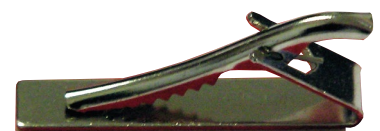
Größe 42 x 8 x 18 mm Gewicht 5 Gramm