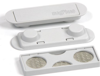
Größe 40 x 16/19 x 9 mm Gewicht 14 Gramm