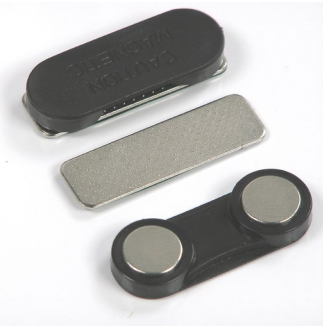
Größe 33 x 12 x 6 mm Gewicht 7 Gramm