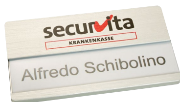
Alu silber matt, ca. 65 x 35 mm, Ecken gerundet, mit Papiereinleger

Das Modell Aluprofil 35 aus der Aluprofil-Familie ist ein Namensschild mit einer besonders großen Druckfläche. Sein großes Sichtfenster eignet sich gut für eine zweizeilige Namensbeschriftung. Die Schildstärke von 3 mm gibt dem Profil sowohl eine optische als auch praktische Stabilität. Anstatt mit Papiereinleger können Sie dieses Modell auch mit Alueinlage mit Namensgravur erhalten. Das Namensschild ist in zwei Längen und Oberflächen lieferbar: ca. 65 x 35 mm und ca. 75 x 35 mm; Aluminium silber matt und Aluminium edelstahloptik gebürstet.