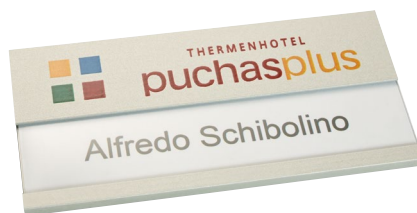
Alu silber matt, ca. 75 x 35 mm, Ecken spitz, mit Papiereinleger