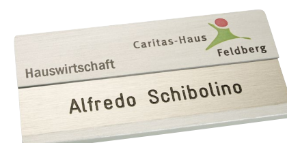
Alu edelstahloptik gebürstet, ca. 75 x 35 mm, Ecken gerundet, mit Alueinleger