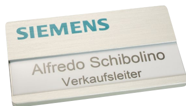
Alu edelstahloptik gebürstet, ca. 65 x 35 mm, Ecken gerundet, mit Papiereinleger