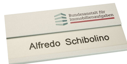
Alu silber matt, ca. 75 x 35 mm, Ecken spitz, mit Alueinleger