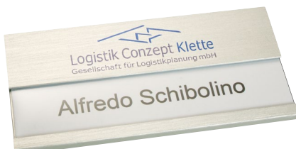
Alu edelstahloptik gebürstet, ca. 75 x 35 mm, Ecken spitz, mit Papiereinleger