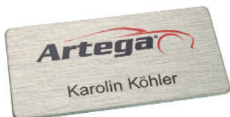
60 x 30 mm R2, Alu edelstahloptik gebürstet, Logo und Name im Digitaldruck