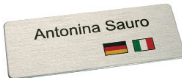
65 x 25 mm R2, Alu edelstahloptik gebürstet, Flaggen- und Namensdruck im Digitaldruck (ohne Weiß)