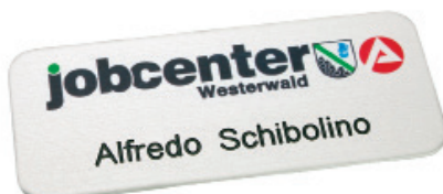
72 x 30 mm R5, Alu silber matt, Logo im Eloxalunterdruck, Name graviert in Standardgravurschrift Arial 1L