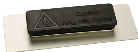
Rückseite, Befestigung mit Magnet Black-Forte